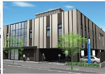
「加茂支店」完成予想図

※ ZEB(ネット・ゼロ・エネルギー・ビル) Net Zero Energy Building の略称で、快適な室内環境を実現しながら、省エネルギー設備や創エネルギー設備の導入により、一次エネルギー消費量をゼロにすることを目指した建物。エネルギー消費量の削減率に応じて3段階に分類される。[ZEB]: 100%以上、Nearly ZEB: 75%以上、ZEB Ready: 50%以上